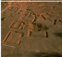
Bibracte, vue de la nécropole de la Croix du Rebut, Tène finale-époque augustéenne, 1998 / cliché Bibracte/A. Maillier