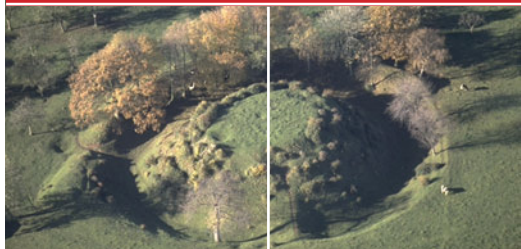
Motte de Fressenneville (Somme)