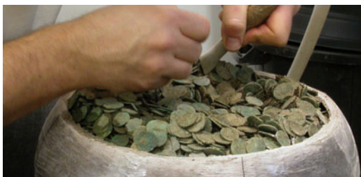
Fouille en laboratoire d'une cruche remplie de monnaies du IIe s. ap. J.-C. (Pannecé, Loire-Atlantique)

Les archéologues professionnels collaborent avec des spécialistes de nombreuses disciplines pour inventorier, étudier puis replacer dans un contexte historique les traces parfois ténues mais toujours significatives de l'histoire des hommes. La publication scientifique et la valorisation des résultats auprès du grand public sont les objectifs majeurs de la profession car toute intervention sur un site archéologique implique la destruction, par l'étude raisonnée, des vestiges de nature diverse enfouis dans le sol.