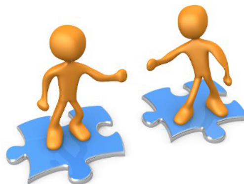
Illustration 5: Demande d'assistance